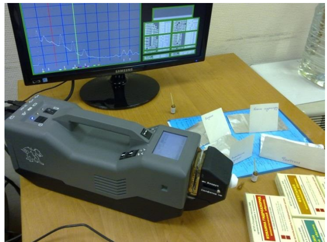
Испытания ИДД Кербер в ФСКН России