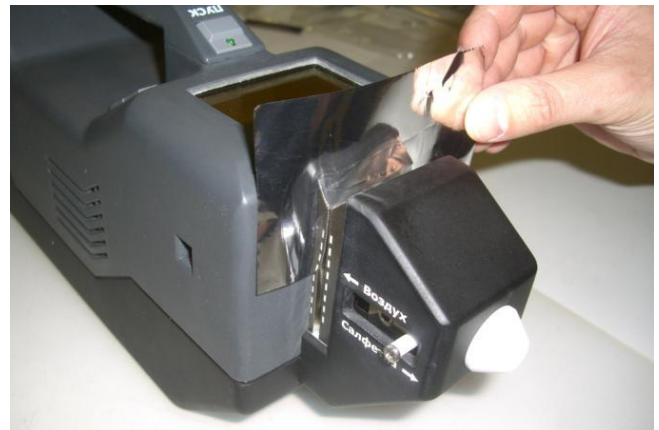
Анализ частиц на пробоотборной салфетке

ИДД КЕРБЕР имеет комбинированный пробозаборник, позволяющий осуществлять как забор воздуха с содержащимися в нем парами и взвешенными частицами веществ, так и забор частиц, собранных на специальной пробоотборной салфетке.