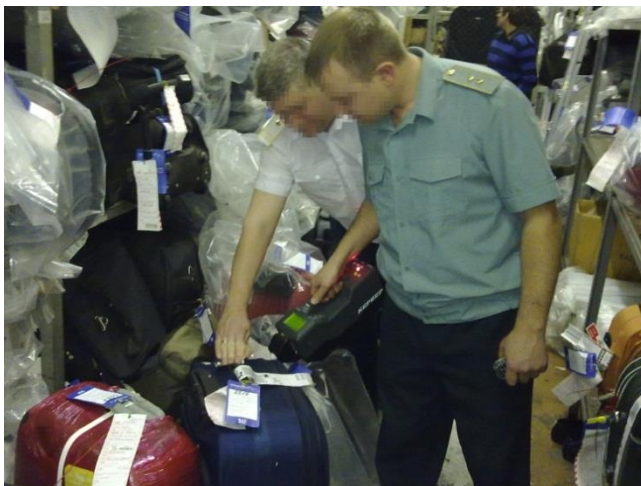
Использование ИДД Кербер сотрудниками таможенных органов для обследования невостребованного багажа