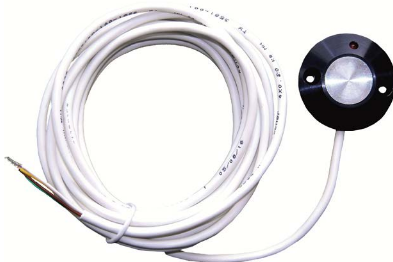
Рисунок 1 – Внешний вид пульта ДУ

Внешний вид пульта ДУ представлен на рисунке 1.